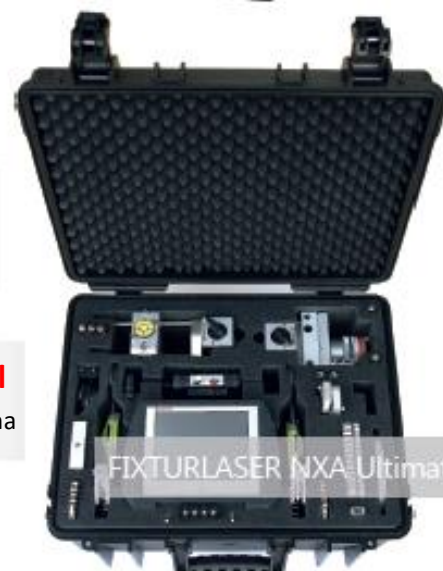
FIXTURLASER NXA Ultimate