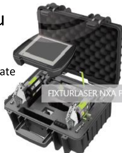
FIXTURLASER NXA Pro

✓ nastavenie súosovosti ✓ geometrické merania ✓ meranie kruhovitosti ✓ dig. vodováha