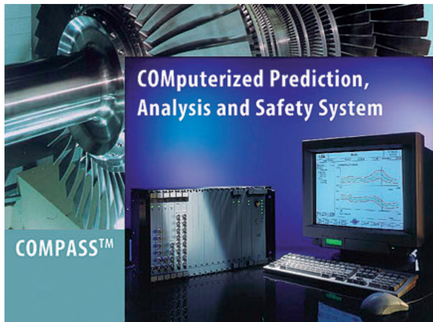
Na monitorovanie technického stavu, ochranu a vibrodiagnostiku rotačných strojov sa využil kombinovaný zabezpečovací a vibrodiagnostický systém Compass™

SLOVNAFT, a.s., už viac ako 15 rokov využíva systém Compass™ na ochranu a vibrodiagnostiku troch existujúcich turbogenerátorov prevádzkovaných v rámci teplárne. V roku 2010 bolo rozhodnuté, že existujúci systém bude rozšírený na monitorovanie technického stavu, ochranu a vibrodiagnostiku nového 60 MW turbogenerátora (výrobca ŠKODA POWER), 2 ks kondenzačných čerpadiel, 4 ks vzduchových ventilátorov